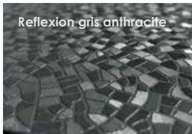
Reflexion gris anthracite

Reflexion, l'éclat d'un diamant taillé pour une eau scintillante.