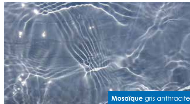
Mosaïque gris anthracite