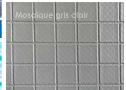
Mosaïque gris clair