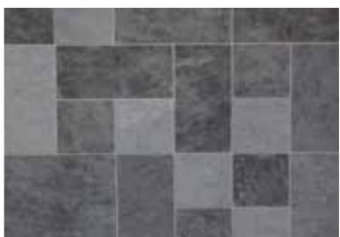
Pierre de Java

Sable, une eau turquoise pour une piscine paradisiaque au motif original.