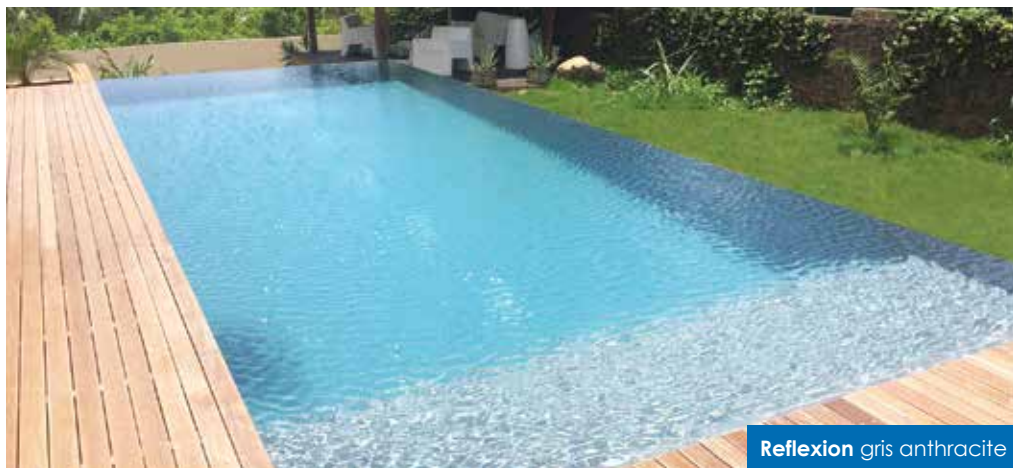
Reflexion gris anthracite