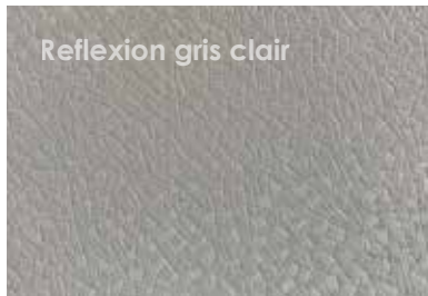
Reflexion gris clair