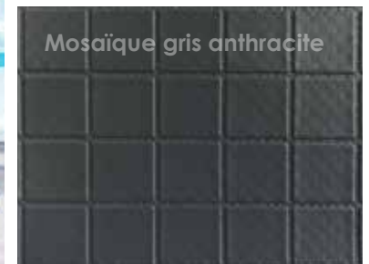
Mosaïque gris anthracite