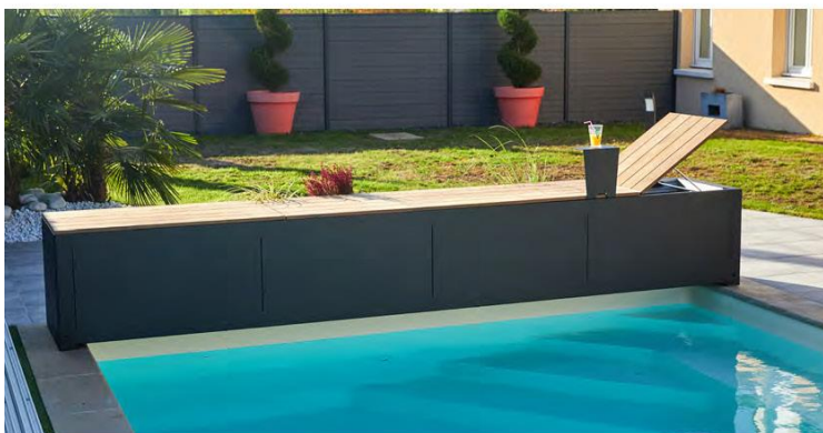
Volet automatique BANC Design (Abribleue)

Les volets mobiles présentent l'avantage de pouvoir être déplacés. Il est ainsi possible de dégager l'espace autour de la piscine lorsqu'elle est utilisée et surtout de couvrir plus facilement des formes de bassin plus compliquées.