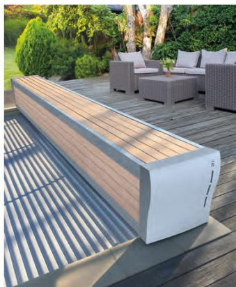
Couverture automatique hors-sol banc Design (Sofatec)

Faciles d'installation et d'utilisation, le volet hors d'eau s'installe en bordure de bassin. Souvent choisi pour être posé sur un bassin déjà construit ou une question de budget, il se décline pour s'adapter à tous les projets.