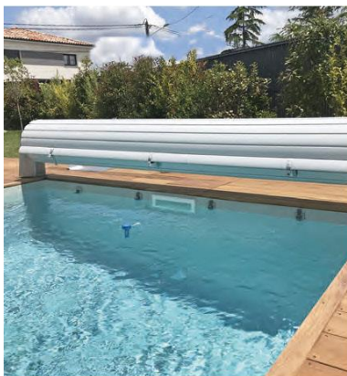
Volet hors-sol, gamme Helios (APF)